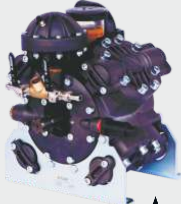
COMET APS 145 ▲