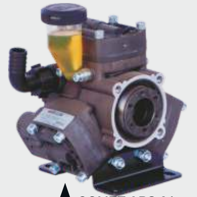
▲ COMET APS 31