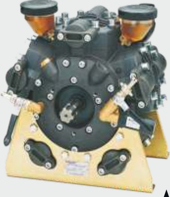
COMET APS 166 ▲