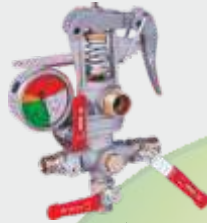
YAYLI REGÜLATÖR ▲