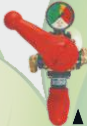
KUMANDA KOLU JOY STICK ▲