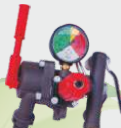
VDR 50 REGÜLATÖR ▲