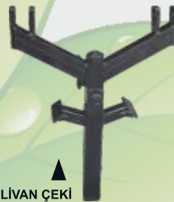
Stoplu PEHLİVAN ÇEKİ TOWBAR ▲