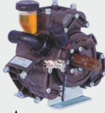
▲ COMET APS 51