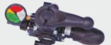
BY MATIC REGÜLATÖR ▲