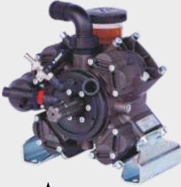
▲ COMET APS 96