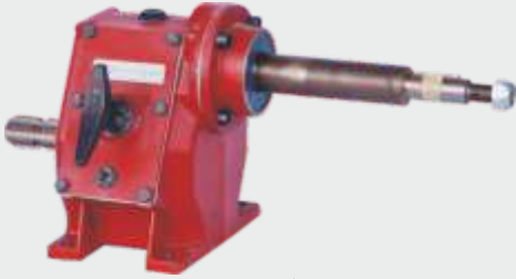
COMER ŞANZUMAN ▲