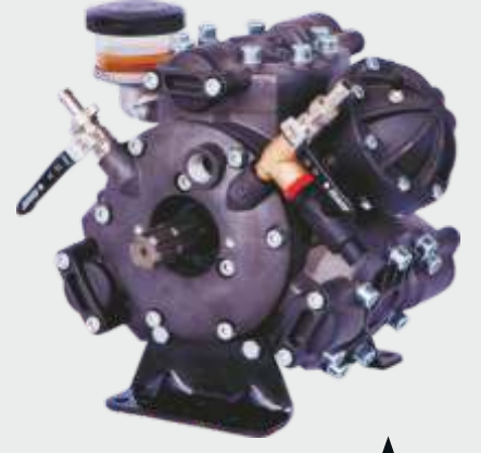
COMET APS 121 ▲