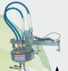
ELEKTRO JET ELECTRO-JET ▲