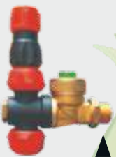
STOPERLİ PLASTİK TURBO MEME ANTID RIP PLASTIC TURBO NOZZLE ▲