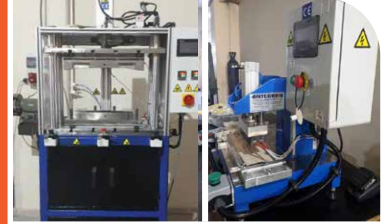
Sıcak Şekillendirme Form Verme Makinası