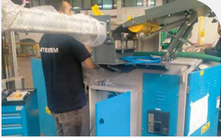
Boya Tesis Sistemleri