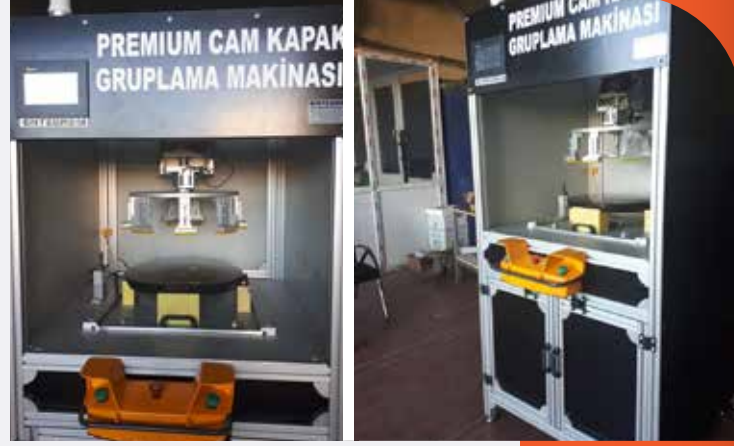
Premium Cam Kapak Gruplama Makinası