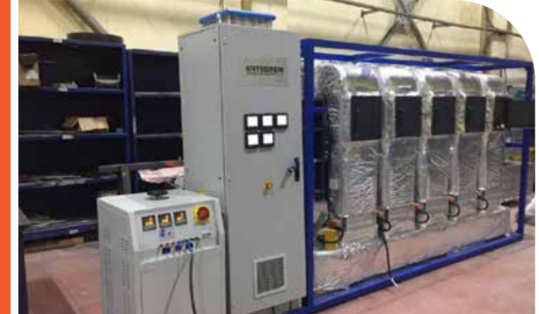
Rezistans Ömür Test Makinası