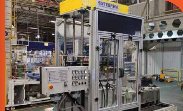
Klima Havşa Açma Makinası