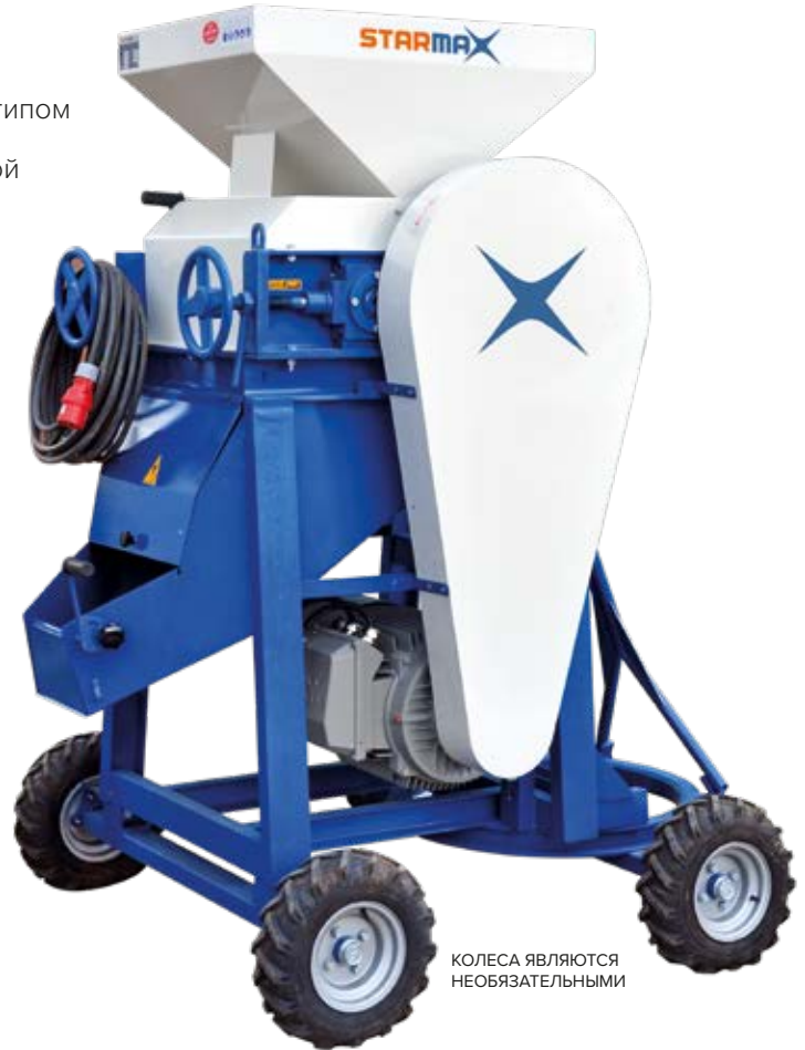
КОЛЕСА ЯВЛЯЮТСЯ НЕОБЯЗАТЕЛЬНЫМИ