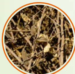
Стебель хлопка и кукурузы