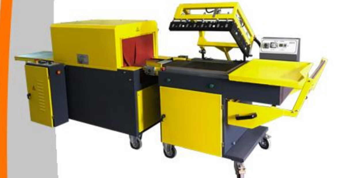
SICAK ÇENE SERİSİ