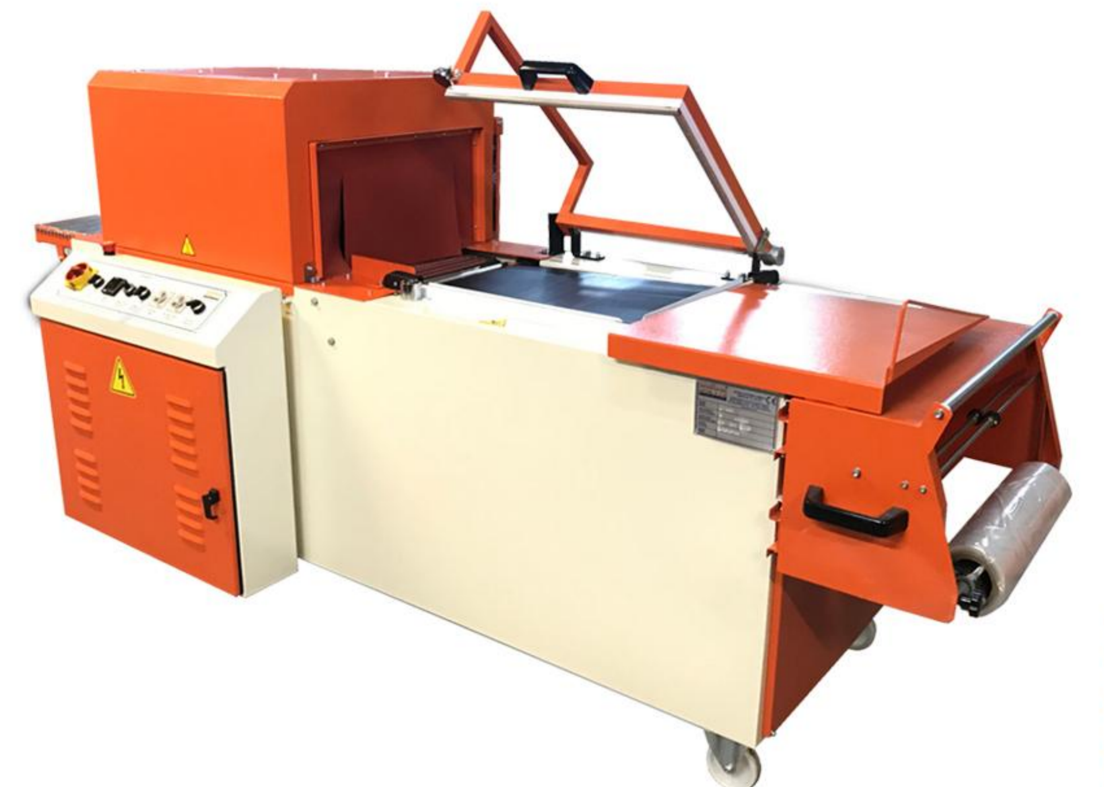
KOMPAKT YARI OTOMATİK