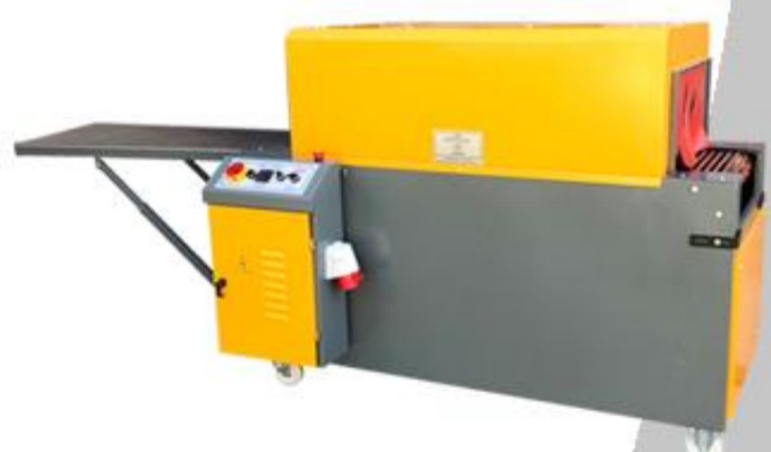
ISI TÜNELİ SERİSİ