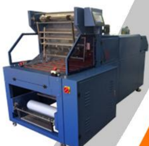
ÖZEL TASARIM MAKİNALAR