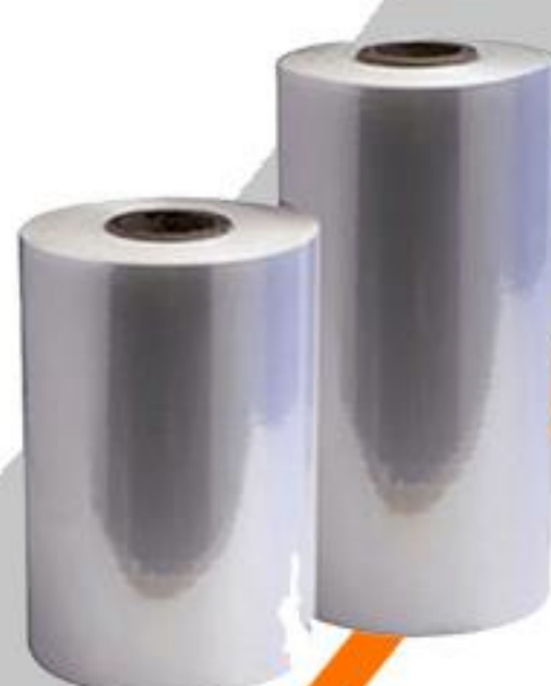
POLYOLEFİN-PVC SHRİNK FİLM