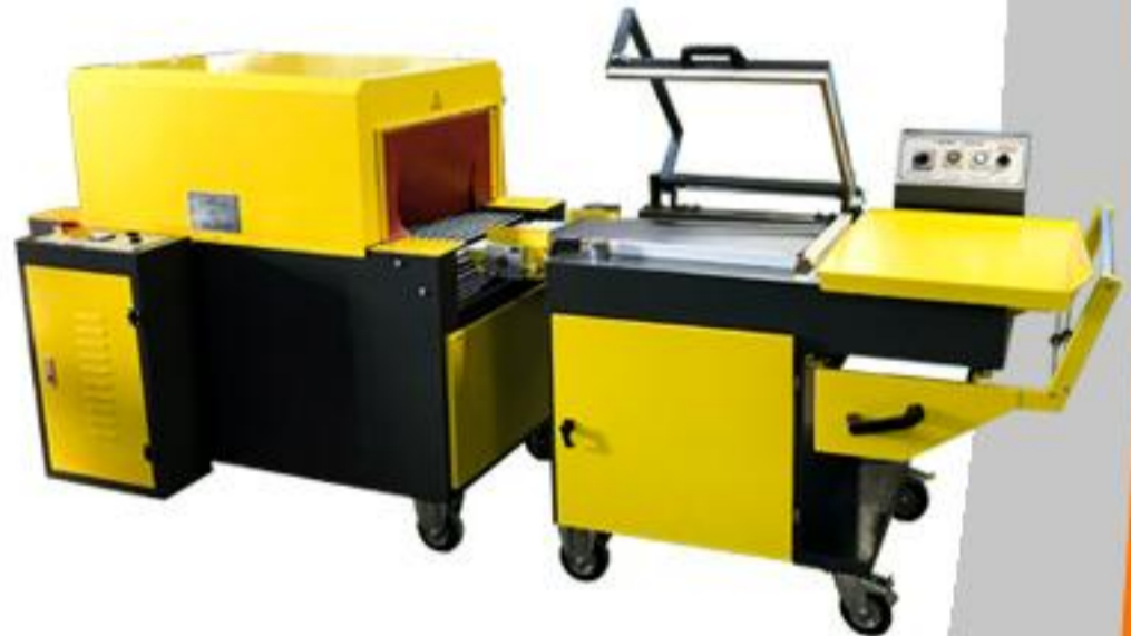
TELLİ ÇENE, SERİSİ