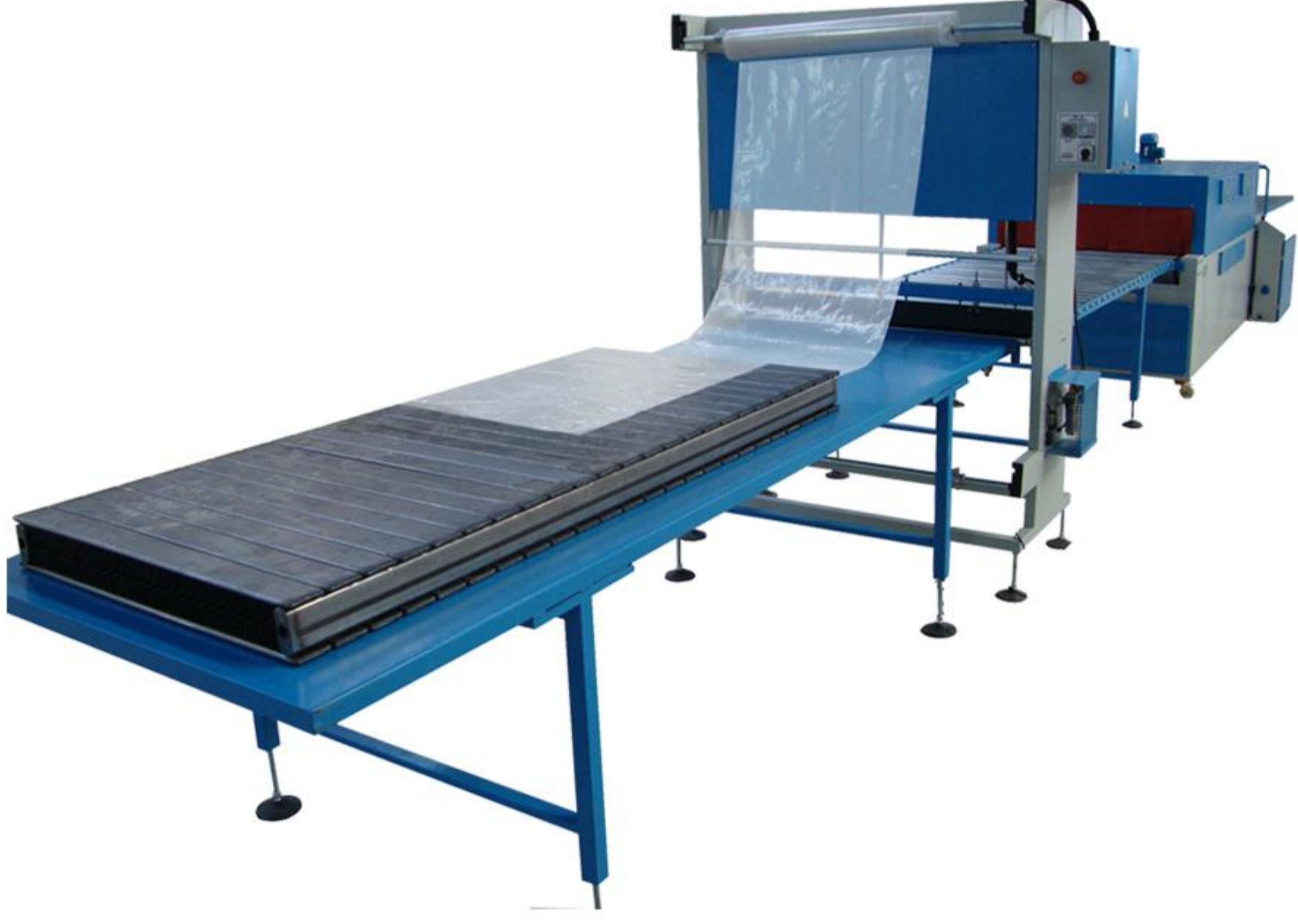
ÖZEL ÖLÇÜ PE PAKETLEME