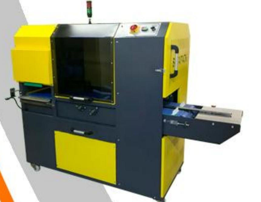
VİYOL KESME SERİSİ