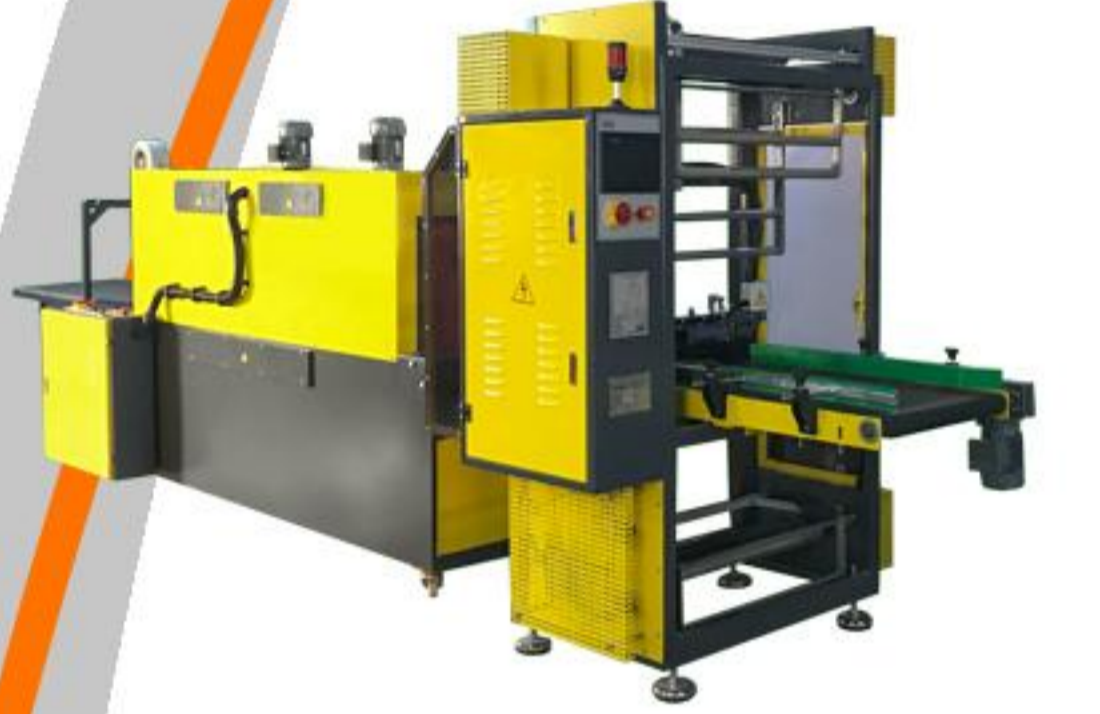
ÖNDEN BESLEMELİ PE SERİSİ