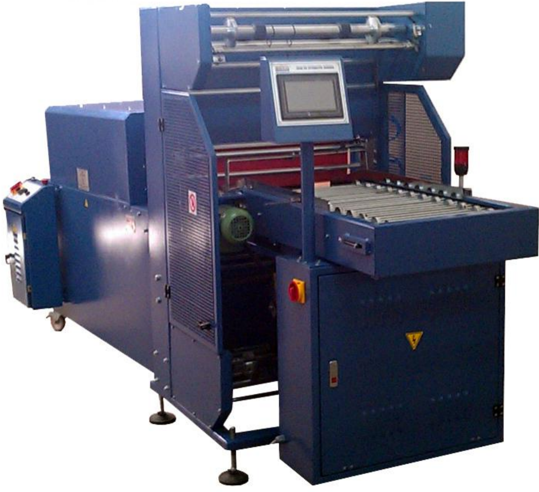
DUVAR KAĞIDI PAKETLEME