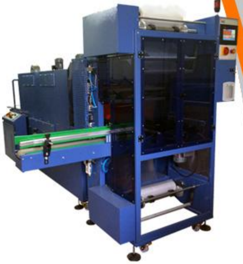
YANDAN BESLEMELİ PE AMBALAJ SERİSİ