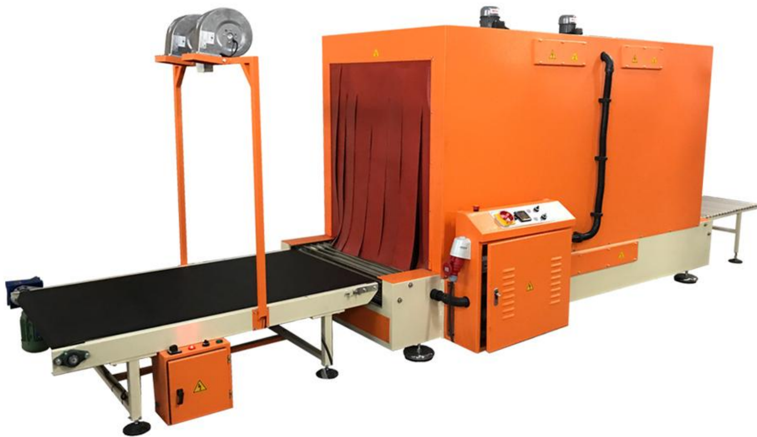
ÖZEL ÖLÇÜ TÜNELLER