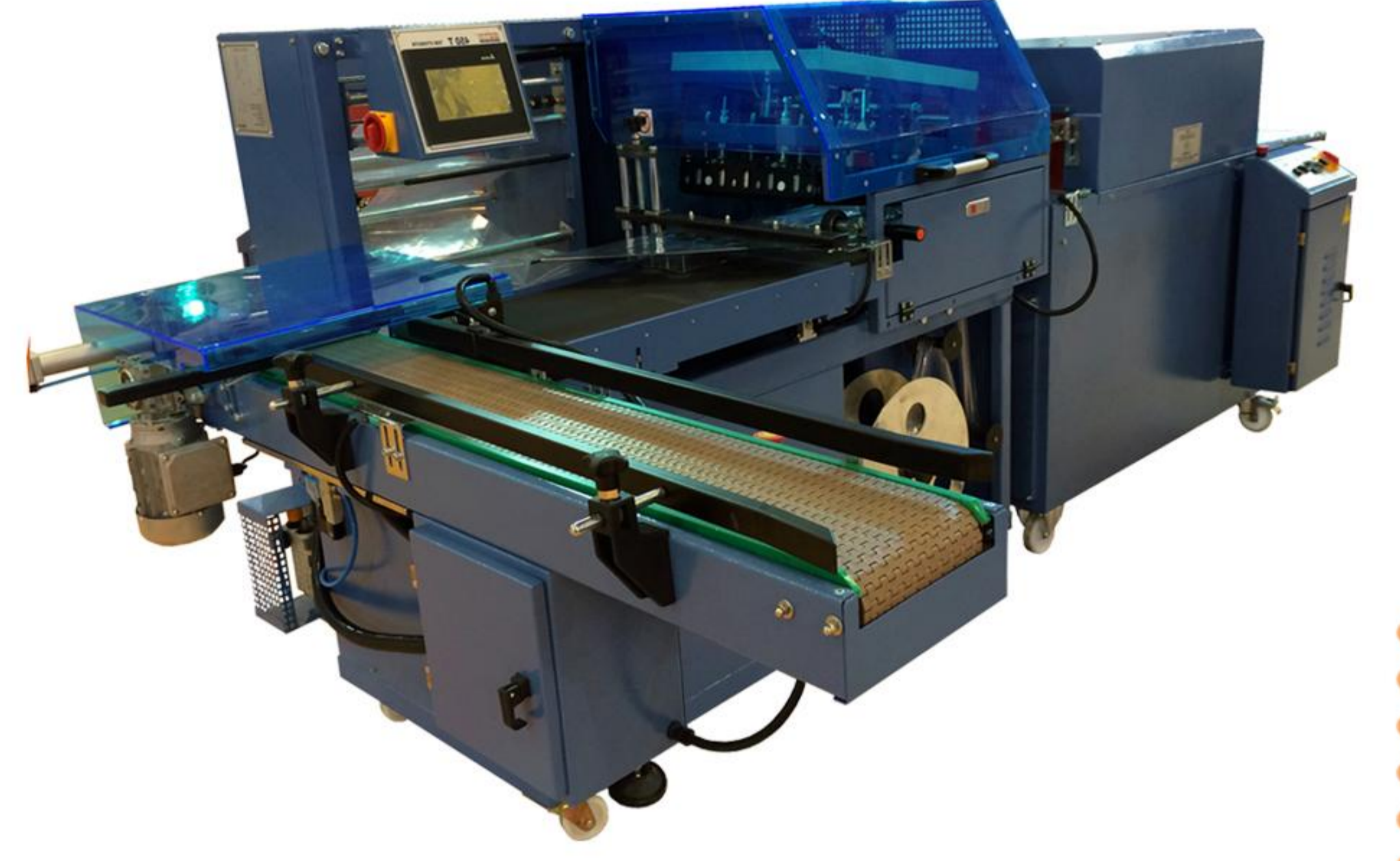
GRUPLAMALI L KESİM