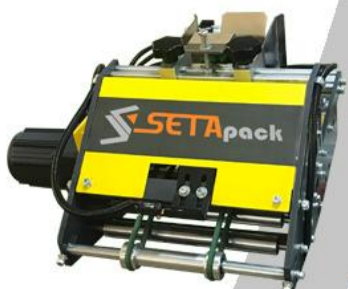
OTOMATİK ETİKET BESLEME SERİSİ