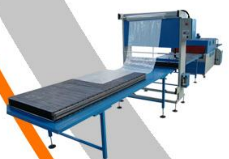
ÖZEL TASARIM MAKİNALAR