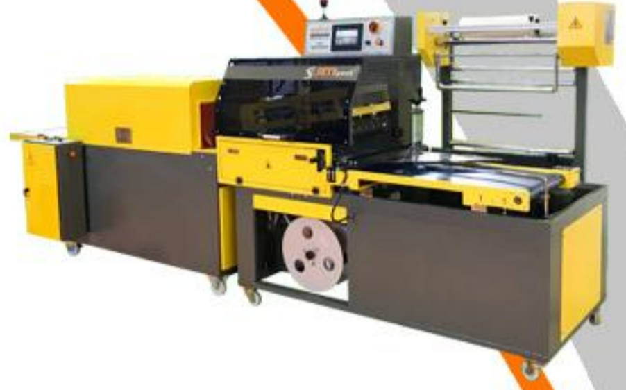
OTOMATİK L KESİM SERİSİ