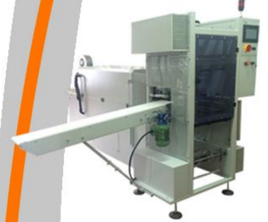
İSTİFLEME PE AMBALAJ SERİSİ