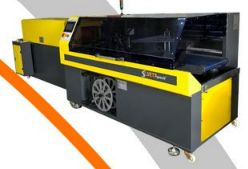
HAREKETLİ ÇENE SERİSİ