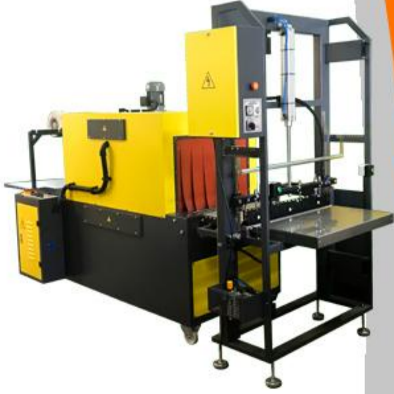
MANUEL PE AMBALAJ SERİSİ