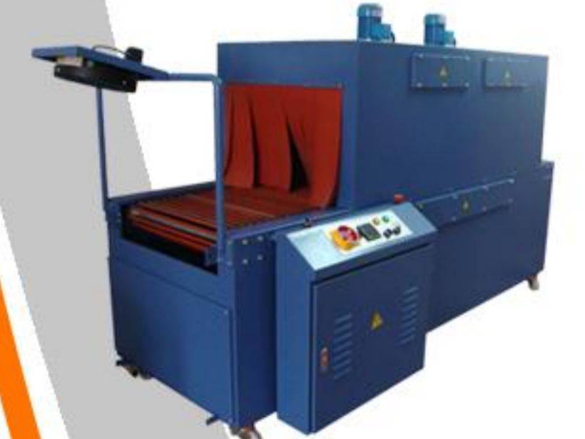
PE ISI TÜNELİ SERİSİ