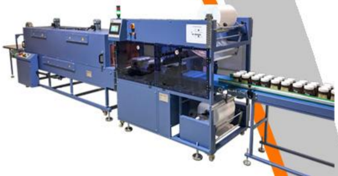
ÖNDEN BESLEMELİ HAREKETLİ PE AMBALAJ SERİSİ