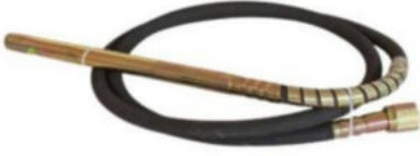
Yarım Ay Vibratör Hortumu Hortum Uzunluğu:4 M Şişe Çapı:Ø 38 Motor Girişi:Yarım Ay Ağırlık:3.9 Kg.