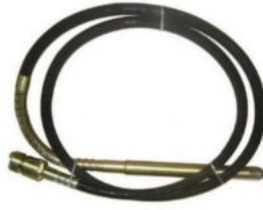
Yarım Ay Vibratör Hortumu Hortum Uzunluğu:6 M Şişe Çapı:Ø 38 Motor Girişi:Yarım Ay Ağırlık:4.5 Kg.