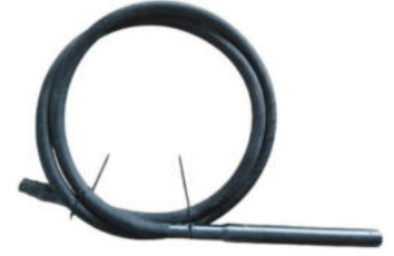
Pimli 3 Hp Beton Vibratör Hortumu Hortum Uzunluğu:4 M Şişe Çapı:Ø 45 Motor Girişi:Kare Başlı ( Pimli ) Ağırlık:4.5 Kg.