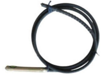
Wacker Muadil Vibratör Hortumu Hortum Uzunluğu:5 M Şişe Çapı:Ø 48 Motor Girişi:Kare Tip (Pimli) Ağırlık:4.2 Kg.