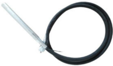
Somunlu 2 Hp Beton Vibratör Hortumu Hortum Uzunluğu:4 M Şişe Çapı:Ø 48 Motor Girişi:Kare Başlı ( Pasolu ) Ağırlık:4.5 Kg.