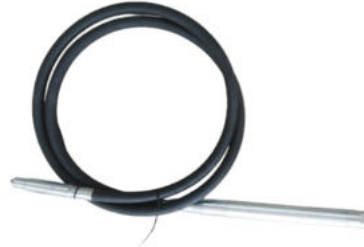
Pimli 2 Hp Beton Vibratör Hortumu Hortum Uzunluğu:4 M Şişe Çapı:Ø 48 Motor Girişi:Kare Başlı ( Pimli ) Ağırlık:4.2 Kg.