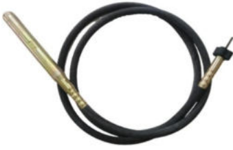
Dingo Tip Vibratör Hortumu Hortum Uzunluğu:4 M Şişe Çapı:Ø 48 Motor Girişi:Kare Başlı ( Pasolu ) Ağırlık:4.2 Kg.