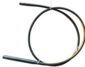
Wacker Tipi 3 Hp Vibratör Hortumu Hortum Uzunluğu:4 M Şişe Çapı:Ø 45 Motor Girişi:Kare Başlı ( Pimli ) Ağırlık:4.0 Kg.