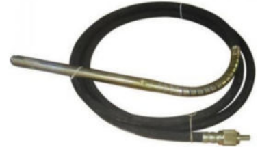
Yarım Ay Vibratör Hortumu Hortum Uzunluğu:4 M Şişe Çapı:Ø 45 Motor Girişi:Yarım Ay Ağırlık:4.0 Kg.