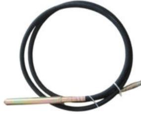
Wacker Tip Vibratör Hortumu Hortum Uzunluğu:5 M Şişe Çapı:Ø 45 Motor Girişi:Kare Başlı Ağırlık:4.2 Kg.