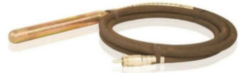
Cat Power 701 Vibratör Hortumu Hortum Uzunluğu:4 M Şişe Çapı:Ø 45 Motor Girişi:Yarım Ay Ağırlık:4.0 Kg.