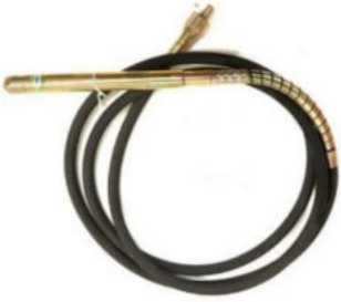
Yarım Ay Vibratör Hortumu Hortum Uzunluğu:6 M Şişe Çapı:Ø 45 Motor Girişi:Yarım Ay Ağırlık:4.7 Kg.