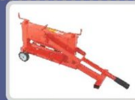
ÇİNI - KARO - PARKE TAŞI PAVING STONE CUTTER ПЕЧАТЬ КАМЕННОГО РЕЗКИ قطع السيراميك والأرضيات