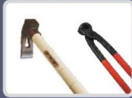
DÖVME ÇELİK KESER DROP FORGED ADZE МОЛОТОК МОНОЛИТЧИКА الفأس بشفرة مصنوعة من الصلب المدرفل