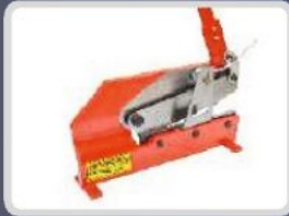
SAC MAKASI KESME SHEET METAL CUTTER НОЖНИЦЫ РЫЧАЖНЫЕ قص بليت "انج"