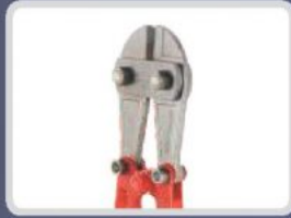
KOLLU DEMİR KESME MAKASLARI BOLT CUTTERS НОЖНИЦЫ ДЛЯ РЕЗКИ АРМАТУРЫ (БОЛТОРЕЗЫ) مقص حديد التسليح ذو المقبض الطويل