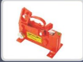
OTURAK DEMİR MAKASLARI REBAR CUTTERS РУЧНЫЕ СТАНКИ ДЛЯ РЕЗКИ АРМАТУРЫ مقص حديد التسليح اليدوي