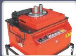
DEMİR BÜKME MAKİNELERİ REBAR BENDING MACHINES СТАНКИ ДЛЯ ГИБКИ АРМАТУРЫ آلة انحناء حديد التسليح