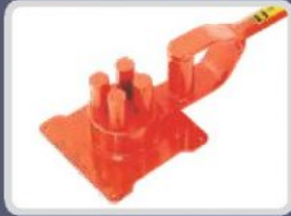
ETRİYE KIVIRMA KOLLARI STIRRUP BENDERS РУЧНЫЕ СТАНКИ ДЛЯ ГИБКИ ХОМУТОВ مفتاح انحناء حديد التسليح