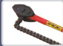
ZİNCİRLİ BORU ANAHTARI CHAIN PIPE WRENCH ЦЕПНОЙ ТРУБНЫЙ КЛЮЧ المفتاح بالسلاسل