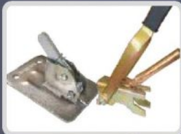
ÇİROZ VE ÇİROZ ANAHTARI RAPID CLAMP ПРУЖИННЫЙ ЗАЖИМ И КЛЮЧ ДЛЯ ПРУЖИННОГО ЗАЖИМА البراغي والمفاتيح ذات الصلة