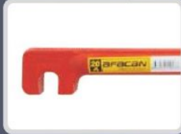
ANAHTARLAR / BÜKME ALETLERİ BENDING TOOLS КЛЮЧИ/ИНСТРУМЕНТЫ ДЛЯ ГИБКИ أنواع المفاتيح وأدوات الثني / مفتاح اف