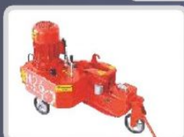
HİDROLİK DEMİR KESME MAKİNELERİ HYDRAULIC REBAR CUTTING MACHINES ГИДРАВЛИЧЕСКИЕ СТАНКИ ДЛЯ РЕЗКИ АРМАТУРЫ آلة قطع حديد التسليح الهيدروليكية