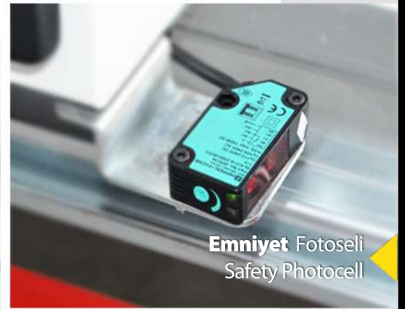
Emniyet Fotoseli Safety Photocell