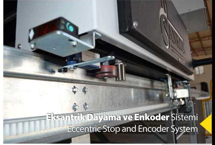
Eksantrik Dayama ve Enkoder Sistemi Eccentric Stop and Encoder System