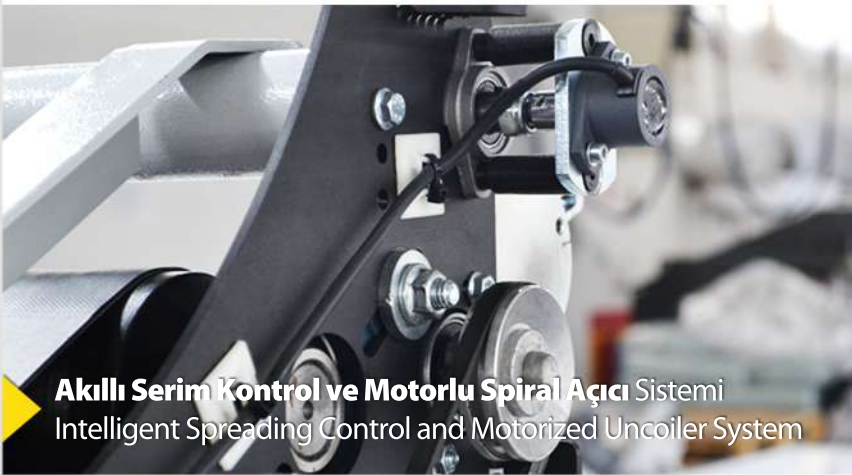
Akıllı Serim Kontrol ve Motorlu Spiral Açıcı Sistemi Intelligent Spreading Control and Motorized Uncoiler System