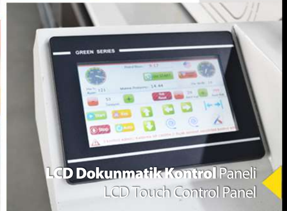
LCD Dokunmatik Kontrol Paneli LCD Touch Control Panel