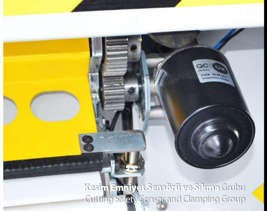
Kesim Emniyet Sensörü ve Sıkma Grubu Cutting Safety Sensor and Clamping Group