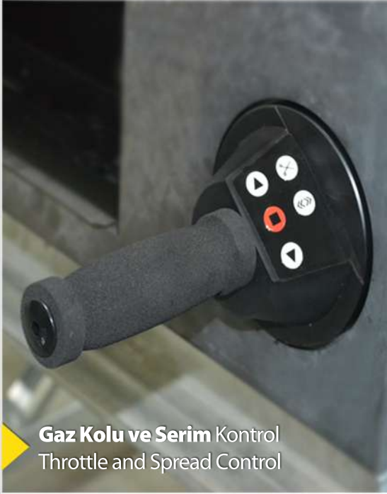
Gaz Kolu ve Serim Kontrol Throttle and Spread Control