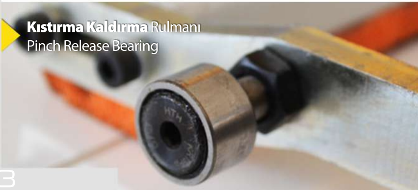
Kıstırma Kaldırma Rulmanı Pinch Release Bearing