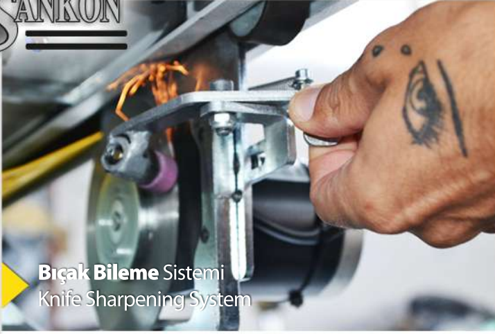
Bıçak Bileme Sistemi Knife Sharpening System