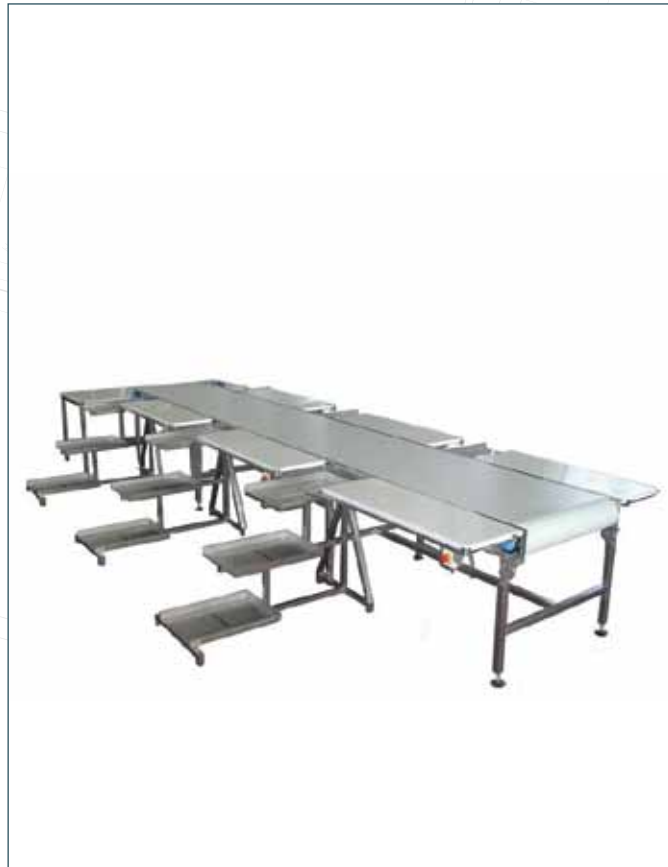
ET İŞLEME KONVEYÖRÜ MEAT PROCESSING CONVEYORS

Meat Processing Tables Meat Processing Conveyors Butcher Working Tables