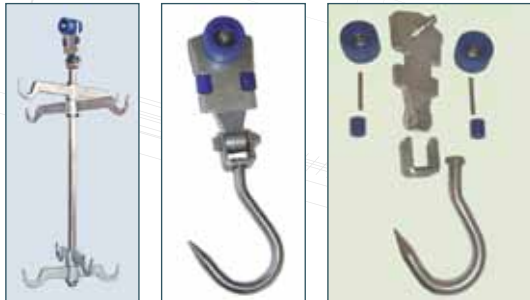
İKİZ RAY KANCA ÇEŞİTLERİ TWIN RAIL HOOKS