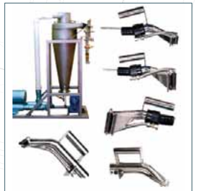
OMURİLİK VAKUM ÇIKARTMA VACUUM SPINAL CORD REMOVAL