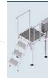
İŞLEME PLATFORMU FIXED PLATFORMS