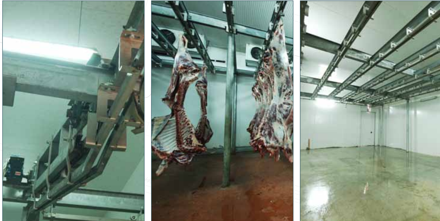
KORİDOR VE SOĞUK ODA RAY SİSTEMLERİ COLD ROOM AND TRANSFER RAIL SYSTEMS