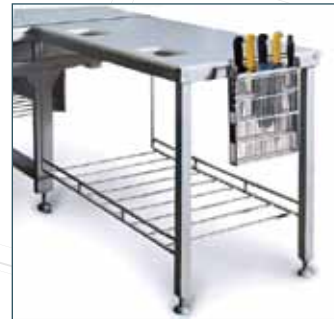
ET İŞLEME MASALARI MEAT PROCESSING TABLES