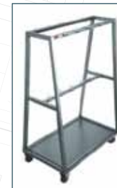
SAKADAT TAŞIMA ARABALARI VISCERA TROLLEYS

Viscera Trolleys Empty Hook Trolleys Fixed Platforms Meat Loading Arm Vacuum Spinal Cord Removal Drenaige Systems