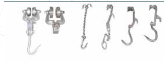
BÜYÜKBAŞ KANCA ÇEŞİTLERİ CATTLE HOOK TYPES