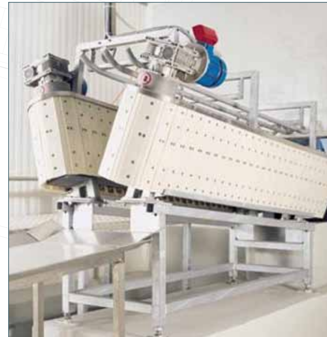
KÜÇÜKBAŞ SABİTLEME ÜNİTESİ SHEEP RESTRAINER

Our sheep slaughterline projects meet the requirements for safety, technology, health and hygiene.