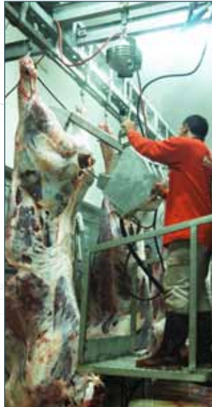
KARKAS BÖLME CARCASS SPLITTING