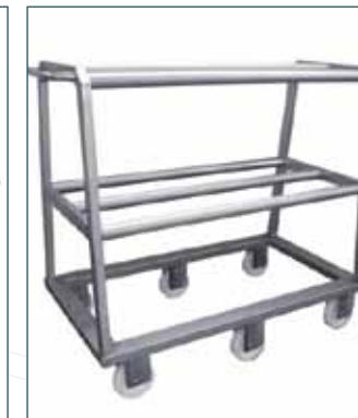
KANCA TAŞIMA ARABASI EMPTY HOOK TROLLEYS