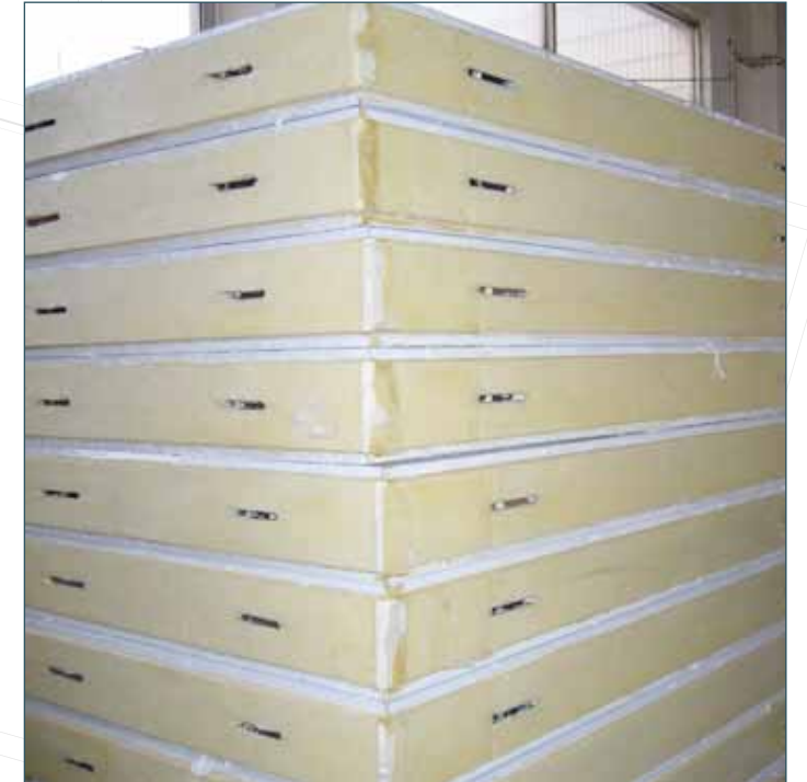
SOĞUK ODA PANELLERİ COLD ROOM PANELS