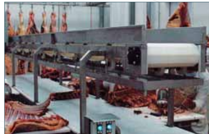
ET İŞLEME KONVEYÖRÜ MEAT PROCESSING CONVEYORS