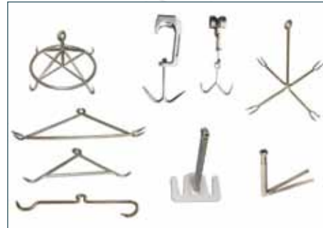
KÜÇÜKBAŞ KANCA ÇEŞİTLERİ SHEEP HOOK TYPES