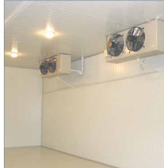
SOĞUTUCU ÜNİTELER COOLING UNITS