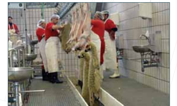
KÜÇÜKBAŞ İŞLEME HATTI SHEEP PROCESSING LINE