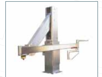
ET YÜKLEME ROBOTU MEAT LOADING ARM