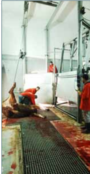
KESİM HÜCRESİ RITUAL KILLING BOX

HELMAKS is a specialized enterprise in the field of cattle slaughtering and processing lines. He provides to his customers slaughter and processing lines with capacity of up to 200 cattle per hour with turn-key projects.