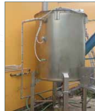
DRENAJ SİSTEMLERİ DRENAIGE SYSTEMS