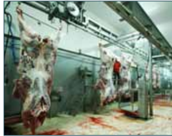
BÜYÜKBAŞ İŞLEME HATTI CATTLE PROCESSING LINE