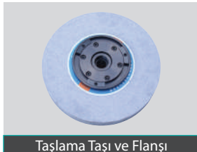
Taşlama Taşı ve Flanşı