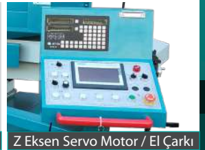
Z Eksen Servo Motor / El Çarkı