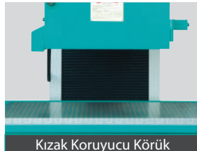
Kızak Koruyucu Köruk