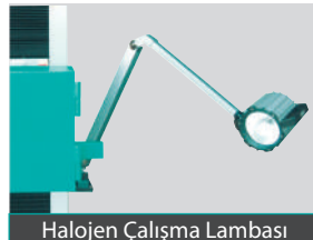
Halojen Çalışma Lambası