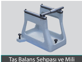
Taş Balans Sehpa'sı ve Mili