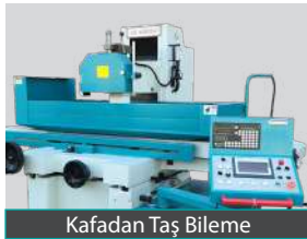
Kafadan Taş Bileme