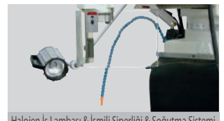
Halojen Iş Lambası &amp; İşmili Siperliği &amp; Soğutma Sistemi