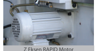
Z Eksen RAPID Motor