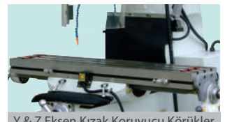
Y &amp; Z Eksen Kızak Korumucu Körükler