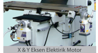
X &amp; Y Eksen Elektrik Motor