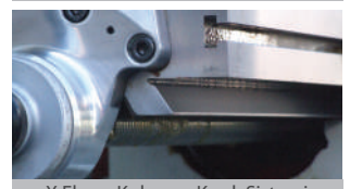
X Eksen Kırılmaç Kızak Sistemi