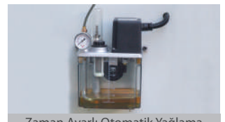
Zaman Ayarlı Otomatik Yağlama