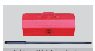
Çektirme Mili &amp; Takım Çantası