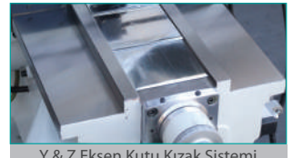
Y &amp; Z Eksen Kutu Kızak Sistemi