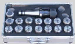
Pens Takımı (15 parça)