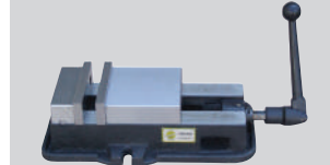
Mengene (150 mm)

Ürünlerin teknik özellikleri ve standart aksesuarlarında önceden bildirim yapmaksızın değişiklik yapma hakkımız saklıdır.