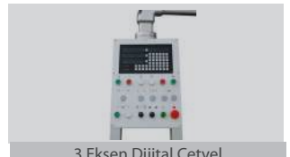
3 Eksen Dijital Cetvel