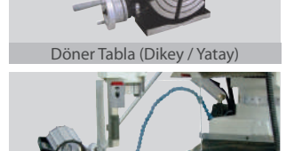
Döner Tabla (Dikey / Yatay)