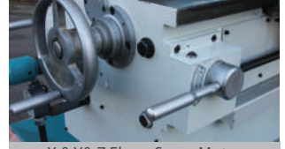
X & Y & Z Eksen Servo Motor