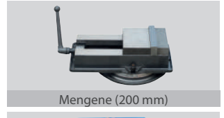
Mengene (200 mm)