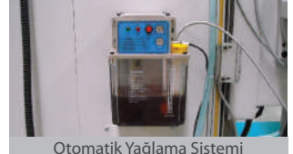
Otomatik Yağlama Sistemi