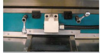
Y/Z Eksen Kutu Kızak Sistemi