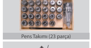
Pens Takımı (23 parça)