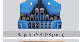
Bağlama Seti (58 parça)