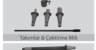
Takımlar & Çektirme Mili