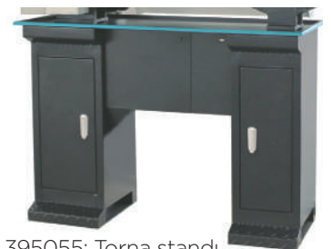
395055: Torna standı