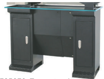
395070: Torna standı