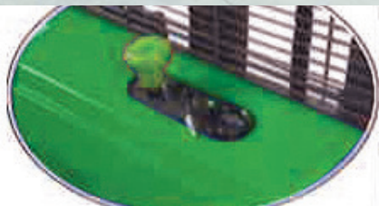
Emniyet / Emergency stop