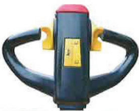
Standar kol / Standard Handle