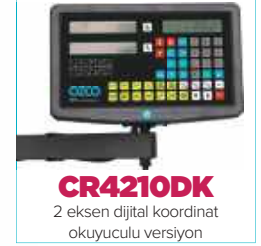
CR4210DK 2 eksen dijital koordinat okuyuculu versiyon