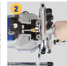
2 Pompa grubunu çıkarın