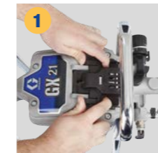
1 Kontrol kapağını kaydırın ve kaldırarak açın