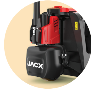
TEKERLEK KORUMA KAPAĞI