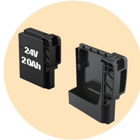
AKÜ & AKÜ KABİNİ