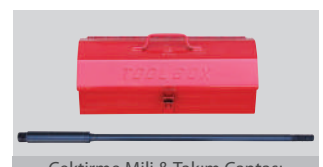
Çektirme Mili &amp; Takım Çantası