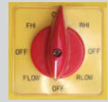
8 Kademeli PAKO Şalter