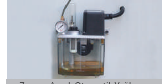
Zaman Ayarlı Otomatik Yağlama