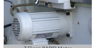
Z Eksen RAPID Motor