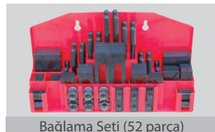
Bağlama Seti (52 parça)