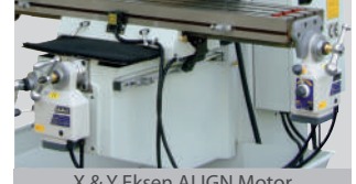
X &amp; Y Eksen ALIGN Motor