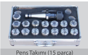
Pens Takımı (15 parça)