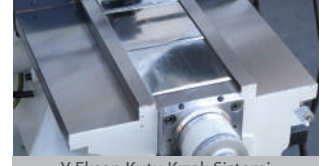
Y Eksen Kutu Kızak Sistemi