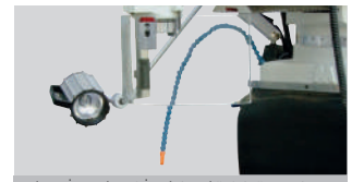
Halojen İş Lambası &amp; İsmili Siperliği &amp; Soğutma Sistemi