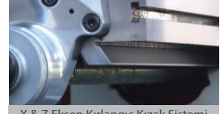
X &amp; Z Eksen Kırılmaç Kızak Sistemi