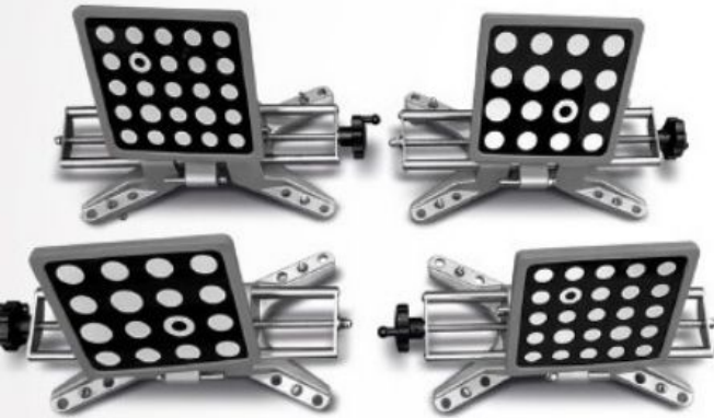
Yeni Ultra Ergonomik Tasarım Ölçüm Aynaları