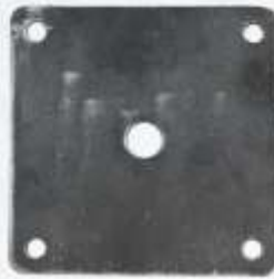
BNB102 017 - KAFES BASKI SACI Valve Cap Pressure Plate Нажимная Пластина Сепаратора ورقة طباعة قفص