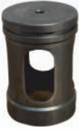
BNB72 016 - KAFES Valve Cap Bracket Сепаратор قفص