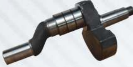
BNB72 002 - KRANK Crank Shaft Коленчатый Вал كرنك