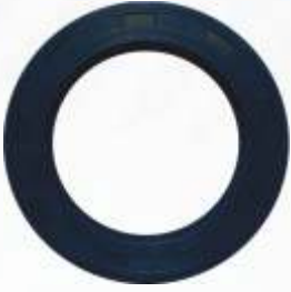
BNB102 028 - YAĞ KEÇESİ Oil Seal Сальник ختم الزيت