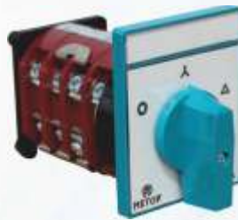
BNB72 047 - YILDIZ ÜÇGEN ŞALTER Star-triangle Switch Переключатель Со Схемой Звезда-треугольни مفتاح نجمة-مثلث