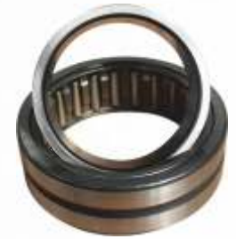
BNB72 033 - BİYEL KOLU RULMANI Connecting Rod Bearing Подшипник Шатуна اسطوانة كرة الذراع