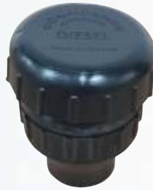
BNB102 044 - DEPO KAPAĞI Tank Cap Крышка Топливного Бака غطاء خزان