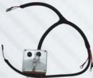
BNB102 046 - DİZEL MOTOR PANOSU Diesel Engine Panel Пульт Управления Дизельного Двигателя لوحة محرك الديزل