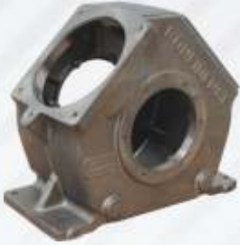
BNB102 001 - KARTER Crankcase Картер حامل عربة