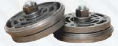
BNB102 015 - KLEPE Flap Запорный Обратный Клапан التمام المنظم