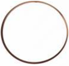
BNB102 031 - KLEPE BAKIR PULU Flap Copper Washer Медная Шайба Запорного Обратного Клапана غسالة النحاس