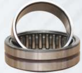
BNB102 033 - BİYEL KOLU RULMANI 1 Connecting Rod Bearing 1 Подшипник Шатуна 1 اسطوانة كرة الذراع