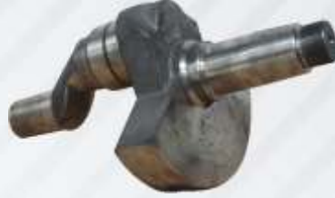
BNB102 002 - KRANK Crank Shaft Коленчатый Вал كرنك