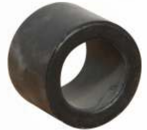
BNB102 021 - KAPLİN PİMİ LASTİĞİ Coupling Pin Rubber Bush Резиновая Втулка Пальца Фланца مطاطة دبوس التوصيل