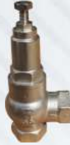
BNB72 026 - EMNİYET VENTİLİ Safety Valve Предохранительный Клапан صمام أمان