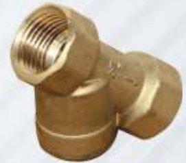
BNB102 036 - PİSLİK TUTUCU Strainer Valve Фильтр مصفاة