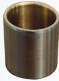
BNB72 032 - BİYEL KOL BURCU Connecting Rod Bush Втулка Шатуна دراع بيل بوش