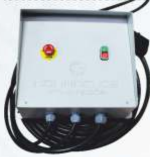
BNB72 053 - YENİ TİP ELEKTRİKLİ MOTOR PANOSU New Type Electric Motor Panel Панель Электродвигателя Нового Типа لوحة محرك كهربائي من النوع الجديد