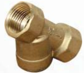
BNB72 036 - PİSLİK TUTUCU Strainer Valve Фильтр مصفاة