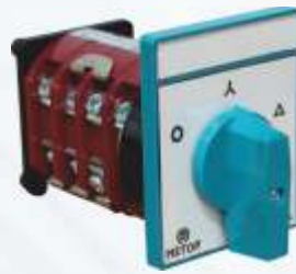
BNB102 047 - YILDIZ ÜÇGEN ŞALTER Star-triangle Switch Переключатель Со Схемой Звезда-треугольни مفتاح نجمة-مثلث