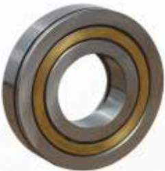
BNB102 034 - ÖN KAPAK RULMANI Front Cover Bearing Подшипник Передней Крышки اسطوانة الغطاء الأمامي