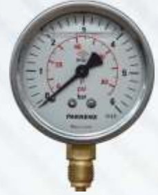
BNB72 027 - MANOMETRE Pressure Gauge Манометр مانوميتر