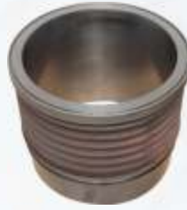
BNB102 005 - GÖMLEK Liner Втулка قميص