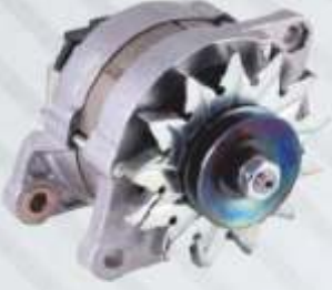
BNB72 049 - ŞARJ DİNAMOSU Charger Dynamo Зарядный Генератор شاحن