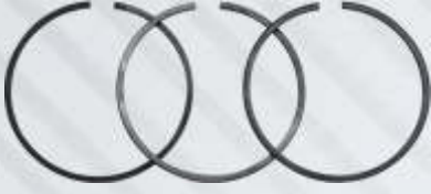
BNB72 025 - PİSTON SEGMANI Piston Ring Поршневое Кольцо حلقة الكباس