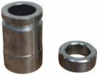
BNB72 019 - KEÇE YATAĞI Seal Housing Картер Уплотнения تحمل الختم