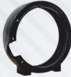
BNB102 014 - DİZEL MOTOR MUHAFAZA Diesel Engine Housing Картер Дизельного Двигателя حافظة محرك الديزل