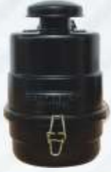
BNB72 037 - KOMPRESÖR FİLTRESİ Compressor Filter Фильтр Компрессора مرشح الضاغط