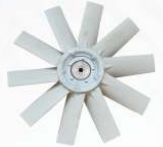
BNB102 042 - PERVANE Propeller Пропеллер المروحة