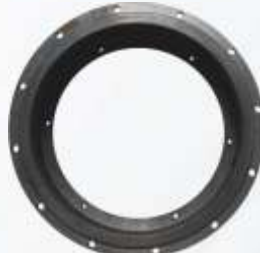
BNB102 011 - DİZEL KAPLİN MUHAFAZA Diesel Coupling Housing Картер Дизельного Фланца حافطة موصلات الديزل