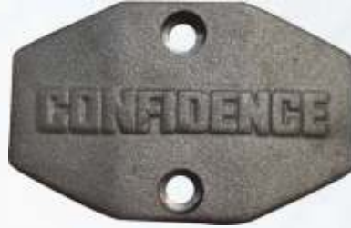
BNB72 017 - KAFES BASKI SADI Valve Cap Pressure Plate Нажимная Пластина Сепаратора ورقة طباعة قفص