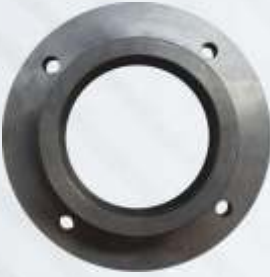
BNB72 007 - ÖN KAPAK Front Cover Передняя Крышка الغلاف الامامي