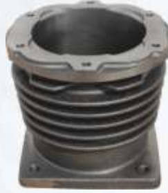
BNB72 005 - GÖMLEK Liner Втулка قميص