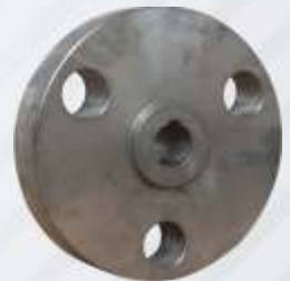
BNB102 012 - ELEKTRİKLI KAPLİN Electric Coupling Электрический Фланец توصيل كهربائي