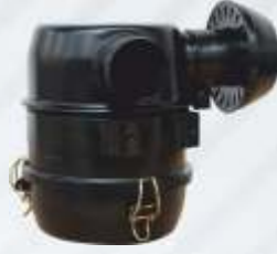
BNB72 038 - MOTOR FİLTRESİ Engine Filter Фильтр Двигателя مرشح المحرك