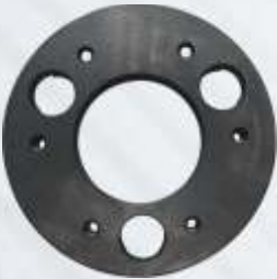
BNB72 010 - DİZEL KAPLİN Diesel Coupling Дизельный Фланец موصلات الديزل