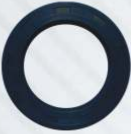
BNB72 028 - YAĞ KEÇESİ Oil Seal Сальник ختم الزيت