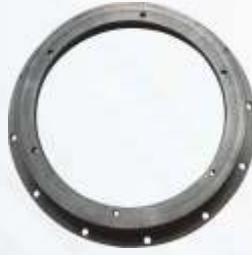
BNB72 011 - DİZEL KAPLİN MUHAFAZA Diesel Coupling Housing Картер Дизельного Фланца حافطة موصلات الديزل