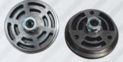
BNB72 015 - KLEPE Flap Запорный Обратный Клапан الثمام المنظم