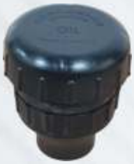
BNB102 043 - YAĞ KAPAĞI Oil Cap Крышка Залива Масла غطاء الزيت