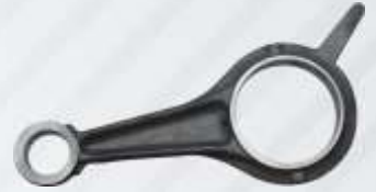
BNB102 006 - BİYEL KOLU Connecting Rod Шатун بييل آرم