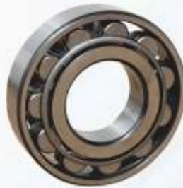
BNB102 035 - ARKA KAPAK RULMANI Rear Cover Bearing Подшипник Задней Крышки اسطوانة الغطاء الخلفي