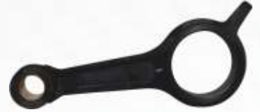
BNB72 006 - BİYEL KOLU Connecting Rod Шатун بييل أرم