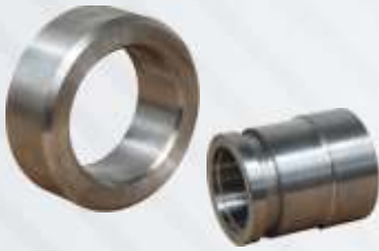
BNB102 019 - KEÇE YATAĞI Seal Housing Картер Уплотнения تحمل الختم