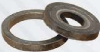
BNB102 022 - KAPLİN PİMİ PULLARI Coupling Pin Washer Шайба Пальца Фланца طوايع دبوس التوصيل