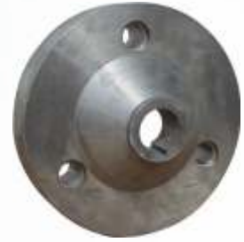
BNB72 009 - KONİK VOLAN Conical Flywheel Конический Маховик الطائر المخروطي