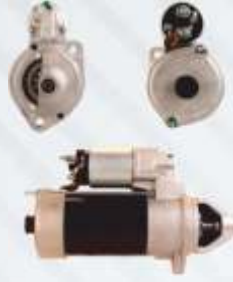
BNB72 050 - MARŞ DİNAMOSU Starter Motor Пусковой Двигатель بدء الدينامو