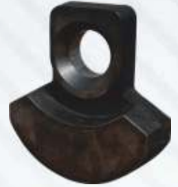
BNB72 003 - KRANK AĞIRLIĞI Crank Shaft Balance Plate Балансирная Плита Коленчатого Вала وزن الكرنك