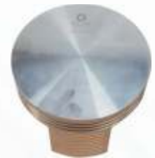
BNB102 024 - PİSTON Piston Пистон مكبس (البستم)