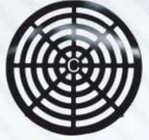
BNB72 051- PERVANE MUHAFAZA Propeller Housing Картер Пропеллера الإسكان المناسب