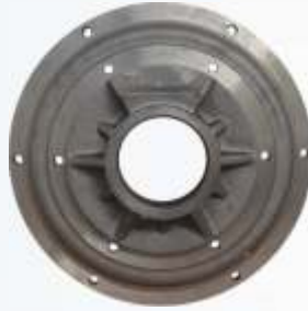
BNB72 008 - ARKA KAPAK Rear Cover Задняя Крышка غطاء خلفي