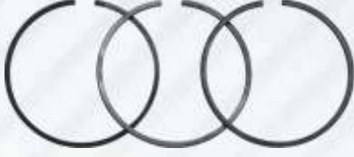
BNB102 025 - PİSTON SEGMANI Piston Ring Поршневое Кольцо حلقة الكباس