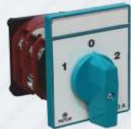
BNB72 048 - YÖN ŞALTERİ Direction Switch Переключатель Направления مفتاح الاتجاه