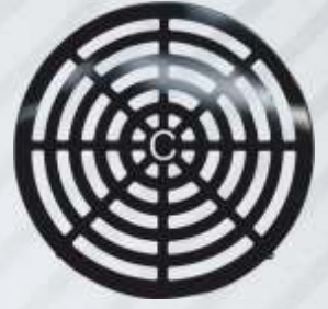
BNB102 051- PERVANE MUHAFAZA Propeller Housing Картер Пропеллера الإسكان المناسب