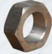
BNB72 018 - KRANK SOMUNU Crank Nut Гайка Коленчатого Вала كرانك الجوز