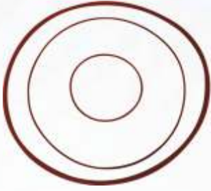
BNB102 052 - ORİNG TAKIMI Valve Cap O'ring Комплект Уплотнительных Колец المجموعة ترتيب