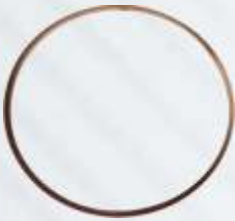
BNB72 031 - KLEPE BAKIR PULU Flap Copper Washer Медная Шайба Запорного Обратного Клапана عسالة النحاس