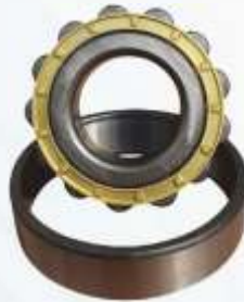
BNB72 035 - ARKA KAPAK RULMANI Rear Cover Bearing Подшипник Задней Крышки اسطوانة الغطاء الخلفي