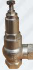
BNB102 026 - EMNİYET VENTİLİ Safety Valve Предохранительный Клапан صمام أمان