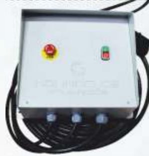
BNB102 053 - YENİ TİP ELEKTRİKLİ MOTOR PANOSU New Type Electric Motor Panel Панель Электродвигателя Нового Типа لوحة محرك كهربائي من النوع الجديد