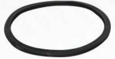
BNB72 030 - KOMPRESÖR FİLTRE LASTİĞİ Compressor Filter Rubber Резина Фильтра Компрессора مطاط ضاغط المرشح