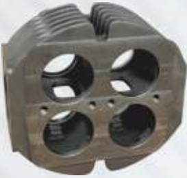
BNB72 004 - HAVA EMME BLOĞU Air Intake Block Блок Воздухозаборника كتلة دخول الهواء