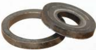
BNB72 022 - KAPLİN PİMİ PULLARI Coupling Pin Washer Шайба Пальца Фланца طوابع دبوس التوصيل