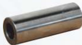
BNB102 023 - PİSTON PİMİ Piston Pin Поршневой Палец المكبس (البستم) دبوس