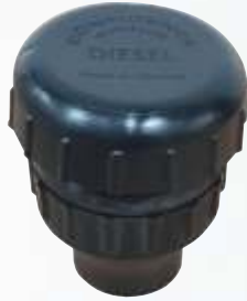
BNB72 044 - DEPO KAPAĞI Tank Cap Крышка Топливного Бака غطاء خزان