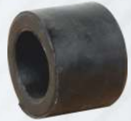
BNB72 021 - KAPLİN PİMİ LASTIĞI Coupling Pin Rubber Bush Резиновая Втулка Пальца Фланца مطاطة دبوس التوصيل