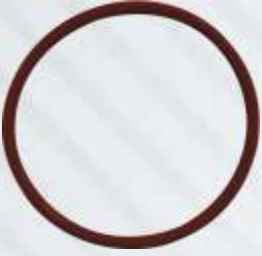
BNB72 052 - KAFES ORİNGİ Valve Cap O'ring Уплотнительное Кольцо ترتيب القفص