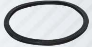
BNB102 030 - KOMPRESÖR FİLTRE LASTİĞİ Compressor Filter Rubber Резина Фильтра Компрессора مطاط ضاغط المرشح