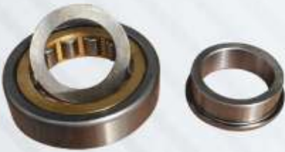
BNB72 034 - ÖN KAPAK RULMANI Front Cover Bearing Подшипник Передней Крышки اسطوانة الغطاء الامامي