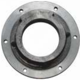
BNB102 007 - ÖN KAPAK Front Cover Передняя Крышка الغلاف الامامي