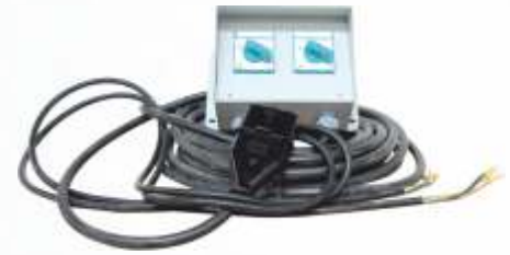
BNB102 045 - ELEKTRİKLİ MOTOR PANOSU Electric Motor Panel Пульт Управления Электродвигателя لوحة محرك كهربائية