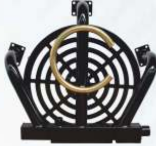
BNB72 041 - RADYATÖR Radiator Радиатор المشعاع