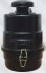
BNB102 037 - KOMPRESÖR FİLTRESİ Compressor Filter Фильтр Компрессора مرشح الضاغط