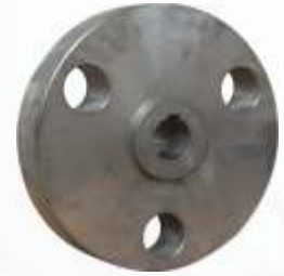
BNB72 012 - ELEKTRİKLİ KAPLİN Electric Coupling Электрический Фланец توصيل كهربائي