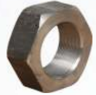
BNB102 018 - KRANK SOMUNU Crank Nut Гайка Коленчатого Вала كرانك الجوز