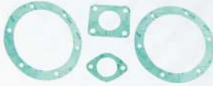
BNB102 029 - CONTA TAKIMI Gasket Kit Комплект Уплотнения طقم حشية