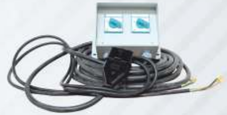
BNB72 045 - ELEKTRİKLİ MOTOR PANOSU Electric Motor Panel Пульт Управления Электродвигателя لوحة محرك كهربائية