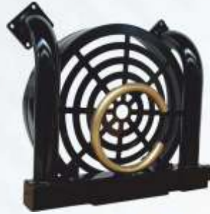
BNB102 041 - RADYATÖR Radiator Радиатор المشعاع