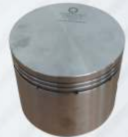
BNB72 024 - PİSTON Piston Пистон مكبس (البستم)