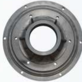
BNB102 008 - ARKA KAPAK Rear Cover Задняя Крышка غطاء خلفي