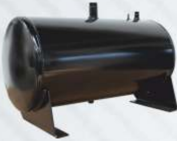
BNB102 040 - MAZOT DEPOSU Fuel Tank Топливный Бак خزان الوقود