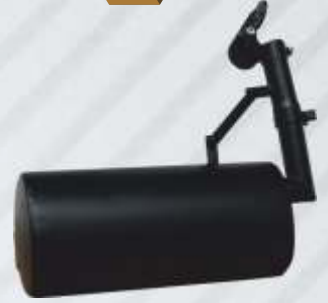
BNB72 039 - EGZOZ Exhaust Выхлоп العادم