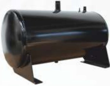
BNB72 040 - MAZOT DEPOSU Fuel Tank Топливный Бак خزان الوقود