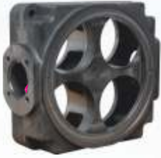
BNB102 004 - HAVA EMME BLOĞU Air Intake Block Блок Воздухозаборника كتلة دخول الهواء