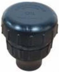
BNB72 043 - YAĞ KAPAĞI Oil Cap Крышка Залива Масла غطاء الزيت