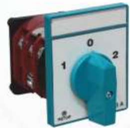
BNB102 048 - YÖN ŞALTERİ Direction Switch Переключатель Направления مفتاح الاتجاه