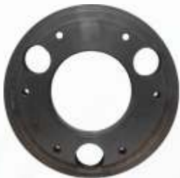
BNB102 010 - DİZEL KAPLİN Diesel Coupling Дизельный Фланец موصلات الديزل