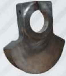
BNB102 003 - KRANK AĞIRLIĞI Crank Shaft Balance Plate Балансирная Плита Коленчатого Вала وزن الكرنك