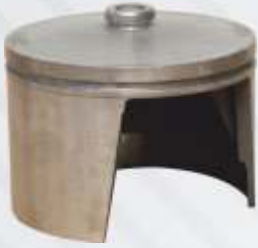
BNB102 016 - KAFES Valve Cap Bracket Сепаратор قفص