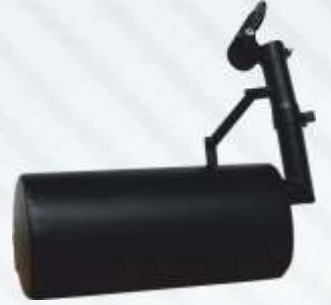
BNB102 039 - EGZOZ Exhaust Выхлоп العادم