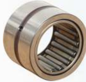
BNB102 032 - BİYEL KOLU RULMANI 2 Connecting Rod Bearing 2 Подшипник Шатуна 2 اسطوانة كرة الذراع