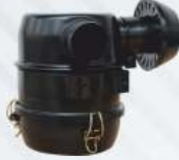
BNB102 038 - MOTOR FİLTRESİ Engine Filter Фильтр Двигателя مرشح المحرك