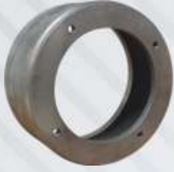
BNB102 013 - ELEKTRİKLİ KAPLİN MUHAFAZA Electric Coupling Housing Картер Электрического Фланца حافظة توصيلات كهربائية