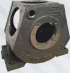
BNB72 001 - KARTER Crankcase Картер حامل عربية