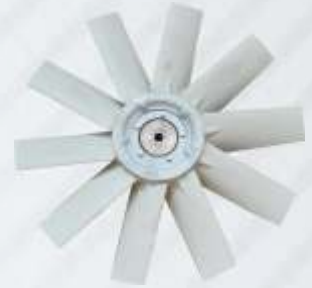
BNB72 042 - PERVANE Propeller Пропеллер المروحة