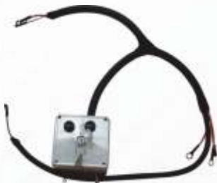
BNB72 046 - DİZEL MOTOR PANOSU Diesel Engine Panel Пульт Управления Дизельного Двигателя لوحة محرك الديزل