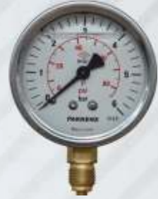
BNB102 027- MANOMETRE Pressure Gauge Манометр مانومتر