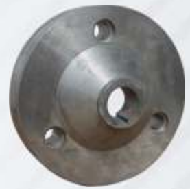
BNB102 009 - KONİK VOLAN Conical Flywheel Конический Маховик الطائر المخروطي