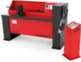
TWIST/SALYANGOZ BÜKÜM MAKİNASI