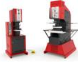
ÇOK AMAÇLI PRES