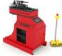
MALAFASIZ CNC BÜKÜM MAKİNELERİ