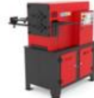
FERFORJE UÇ MAKİNASI