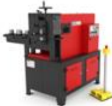
DEMİR BASKI MAKİNASI