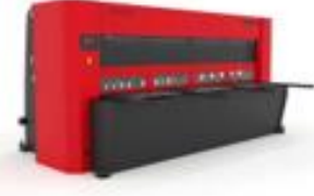
HİDROLİK CNC GIYOTİN MAKAS