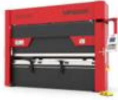
HİDROLİK CNC APKANT PRESLER