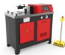
HİDROLİK CNC YATAY PRES