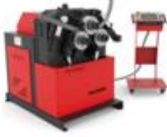
PROFİL KIVIRMA MAKİNELERİ