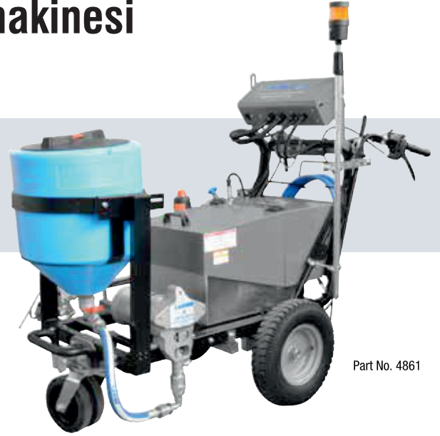
Part No. 4861

Larius deneyimi fark: kanıtlanmış performans tanımlanmış çizgiler için