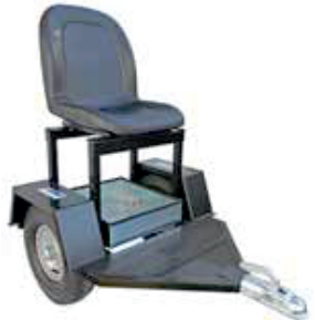
Part No. 4720