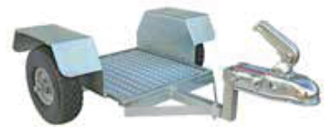
Part No. 26000