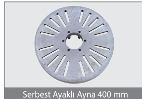
Serbest Ayaklı Ayna 400 mm