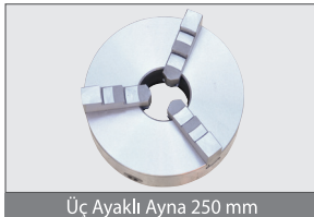
Üç Ayaklı Ayna 250 mm