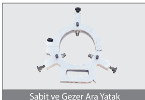
Sabit ve Gezer Ara Yatak