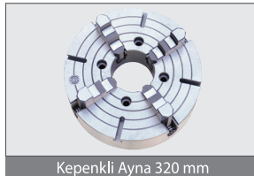
Kepekli Ayna 320 mm