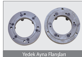
Yedek Ayna Flansları