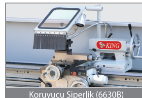
Koruyucu Siperlik (6630B)