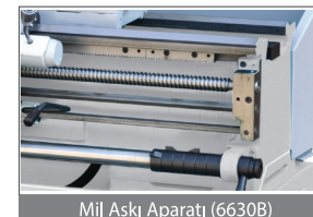
Mil Askı Aparatı (6630B)