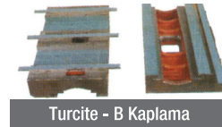
Turcite - B Kaplama

C5 Sınıfı Bilyalı Miller X ve Y Eksenine Monte Edilerek İlerlemelerin Daha Hassas, Kaliteli Boşluksuz Uzun Süreli Çalışmayı Garantiler