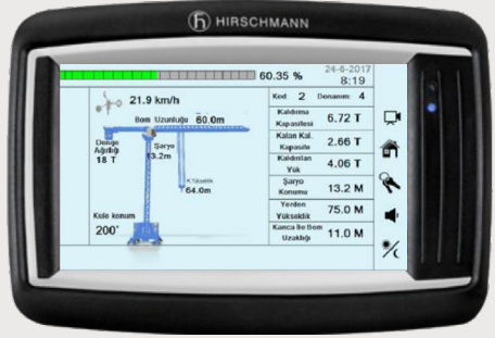
KULE MKS KONSOL