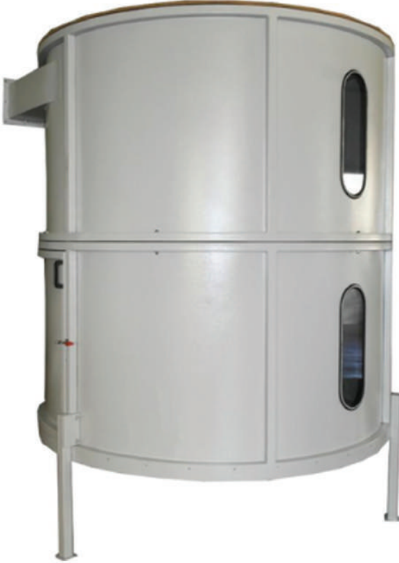
RESERVE TOWER REZERVE KULESİ