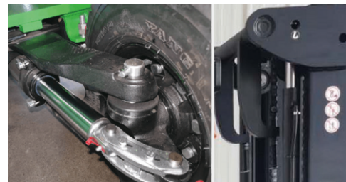
Direksiyon Dingili Asansör