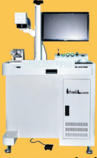
MASA TİPİ LAZER MAKİNA