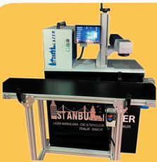
FLY MARKİNG LAZER MAKİNA