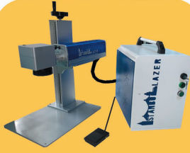
PORTATİF TİP LAZER MAKİNA