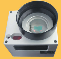
OTOMATİK FOCUS LAZER MAKİNA