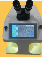
LAZER KUYUMCU KAYNAK MAKİNA