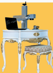
AVANGARDE TİP LAZER MAKİNA