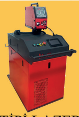
EL TİPİ LAZER KAYNAK MAKİNA