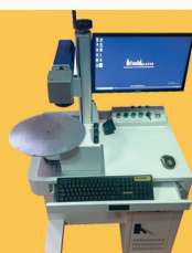
DÖNEN TABLA LAZER MAKİNA