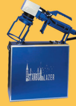
TABANCAI TİP LAZER MAKİNA