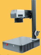
MİNİ EKONOMİK LAZER MAKİNA