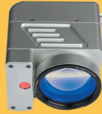
KAMERALI TİP LAZER MAKİNA