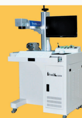
3D LAZER MAKİNA