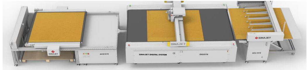
Tam otomatik oluklu kesim hattı