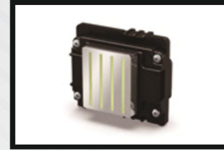
i3200 Yüksek hızlı & Endüstriyel Baskı kafası