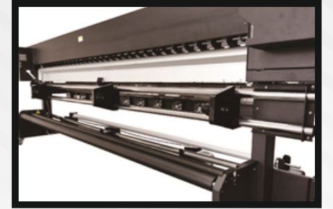
Folyo Baskısına Uygun Besleme Ünitesi