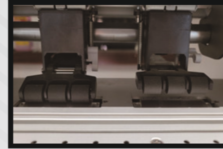
Birbirinden bağımsız çalışabilen pinch roller