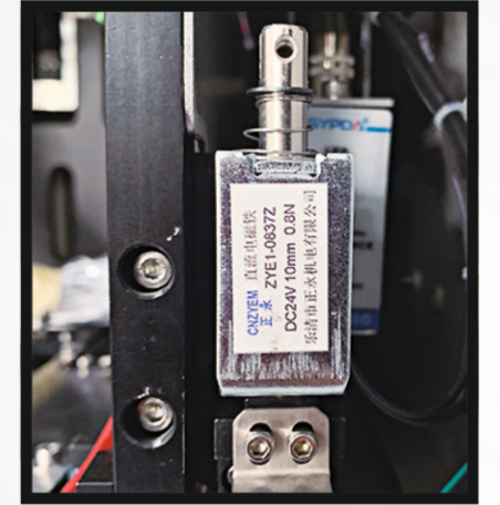
Kafa Yüksekliği Algıma