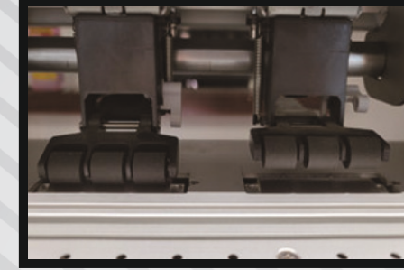
Birbirinden bağımsız çalışabilen pinch roller