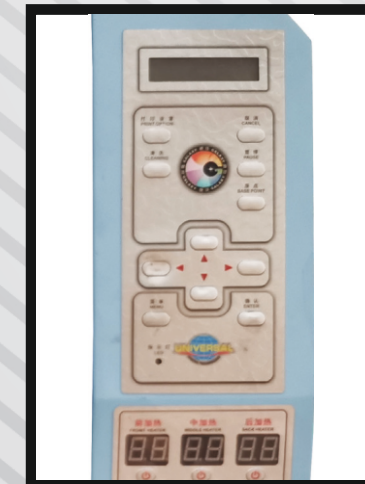
Dijital Kontrol Paneli