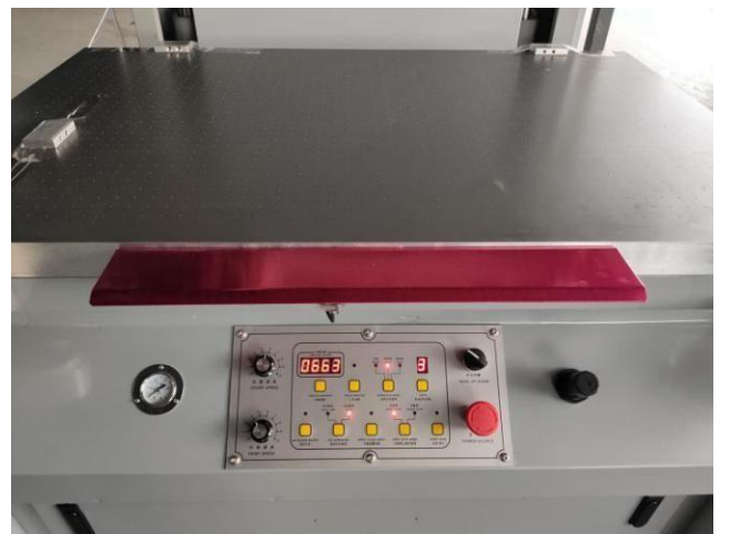
Yüksek Hassasiyetli Vakum Masası