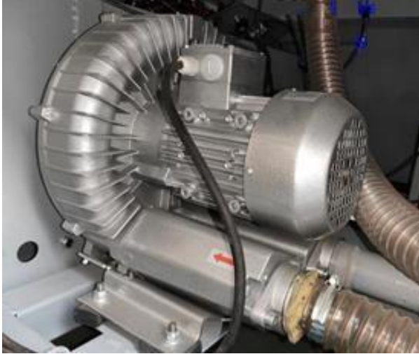
Güçlü Vakum Pompası