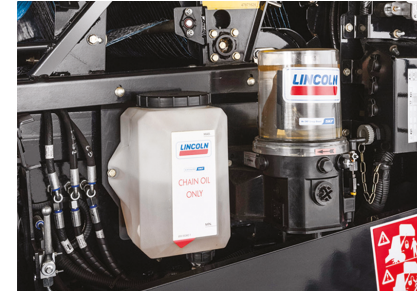
Otomatik gresleme sistemi