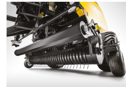
Yüksek kapasiteli toplama ünitesi