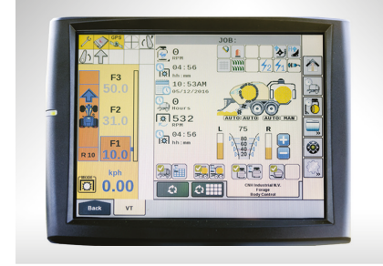
Geniş, renkli ve dokunmatik ekranlı IntelliView™ IV monitör