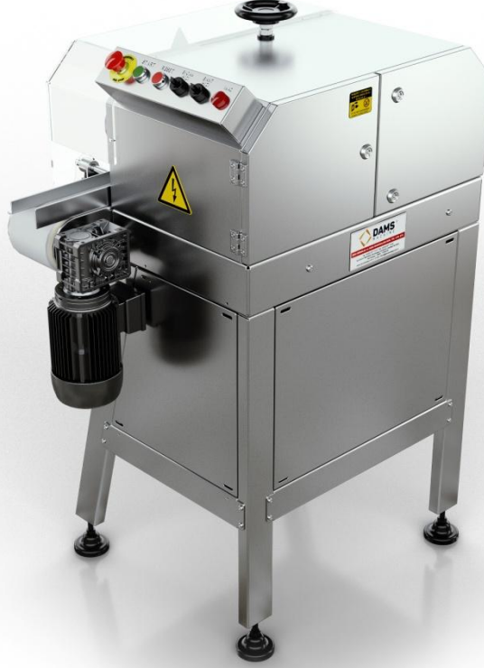
DAMS Ekmek Kesme Beslemesiz / DEKS -20