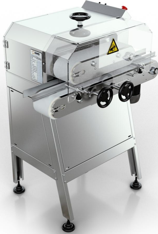
DAMS Ekmek Kesme Beslemesiz / DEKS -20