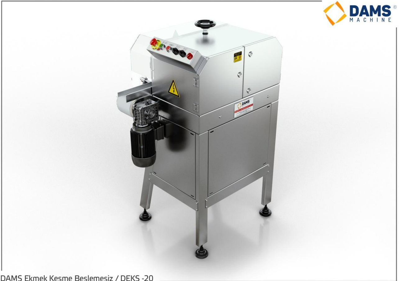
DAMS Ekmek Kesme Beslemesiz / DEKS -20

Dünyanın her yerinde Sadecemükemmelisunar