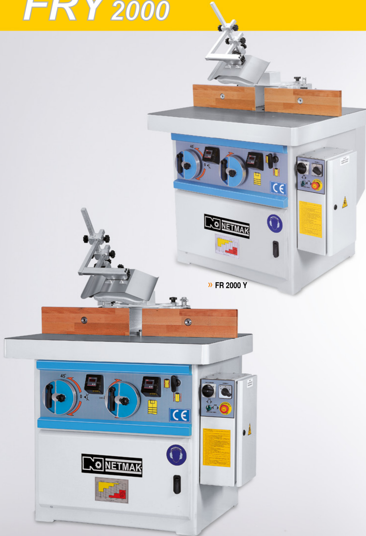
» FR 2000 Y